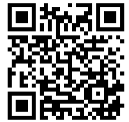
報名表 QR Code