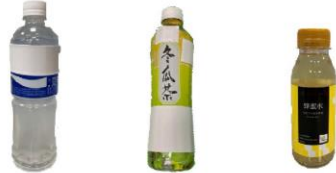
運動飲料 冬瓜茶 蜂蜜水