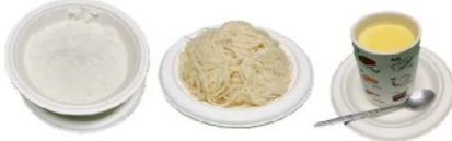
白稀飯 白麵條/麵線 無料蒸蛋