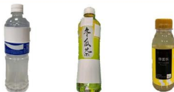
運動飲料 冬瓜茶 蜂蜜水