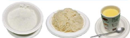
白稀飯 白麵條/麵線 無料蒸蛋